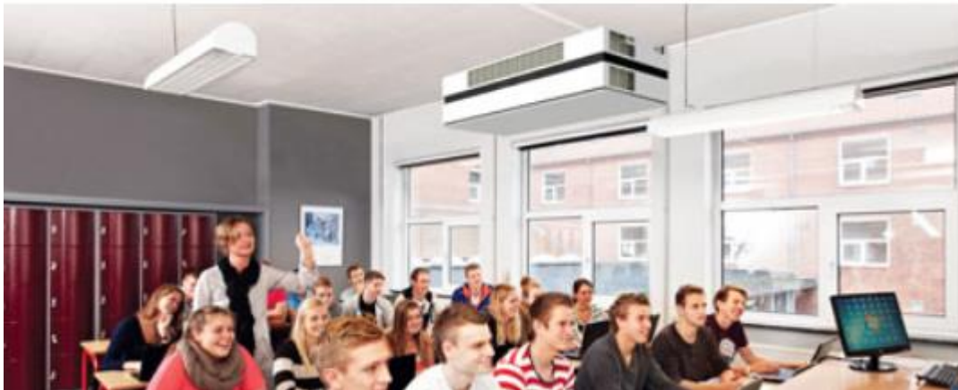
Abbildung 1 -Abbildung aus den Produktunterlagen von Exhausto VEX308 vom 31.08.2017

Für die Ermittlung der zu erwartenden Kosten wurden dezentrale Lüftungsgeräte mit einem mind. Luftvolumenstrom von 150 m 3 /h und einem max. Luftvolumenstrom von 850 m 3 /h berücksichtigt. Für die Erfüllung des benötigten Zuluft-Volumenstroms im Raum Betreuung 2 werden zwei Geräte benötigt. Inbegriffen in jedem Gerät ist ein Heizregister, eine CO 2 -Steuerung und Präsenzsteuerung, Brandschutzklappen und der Einbau des Gerätes. In der Summe belaufen sich die Kosten für die Kostengruppe 400 auf ca. 30.000,00 €. Über die BAFA können als Hinweis mit dem Förderprogramm „Bundesförderung Corona-Gerechte stationäre raumluftechnischen Anlagen“, 80% der Gesamtkosten über den Staat finanziert und 20% müssen durch den Antragssteller in Eigenleistung erbracht werden. Somit würden sich die Kosten des Antragstellers auf 6.000,00 € belaufen. Die Instandhaltung- und Wartungskosten schätzen wir auf ca. 800,00 € pro Jahr zzgl. der Energiekosten von ca. 400,00 € Strom und 175,00 € Wärme.