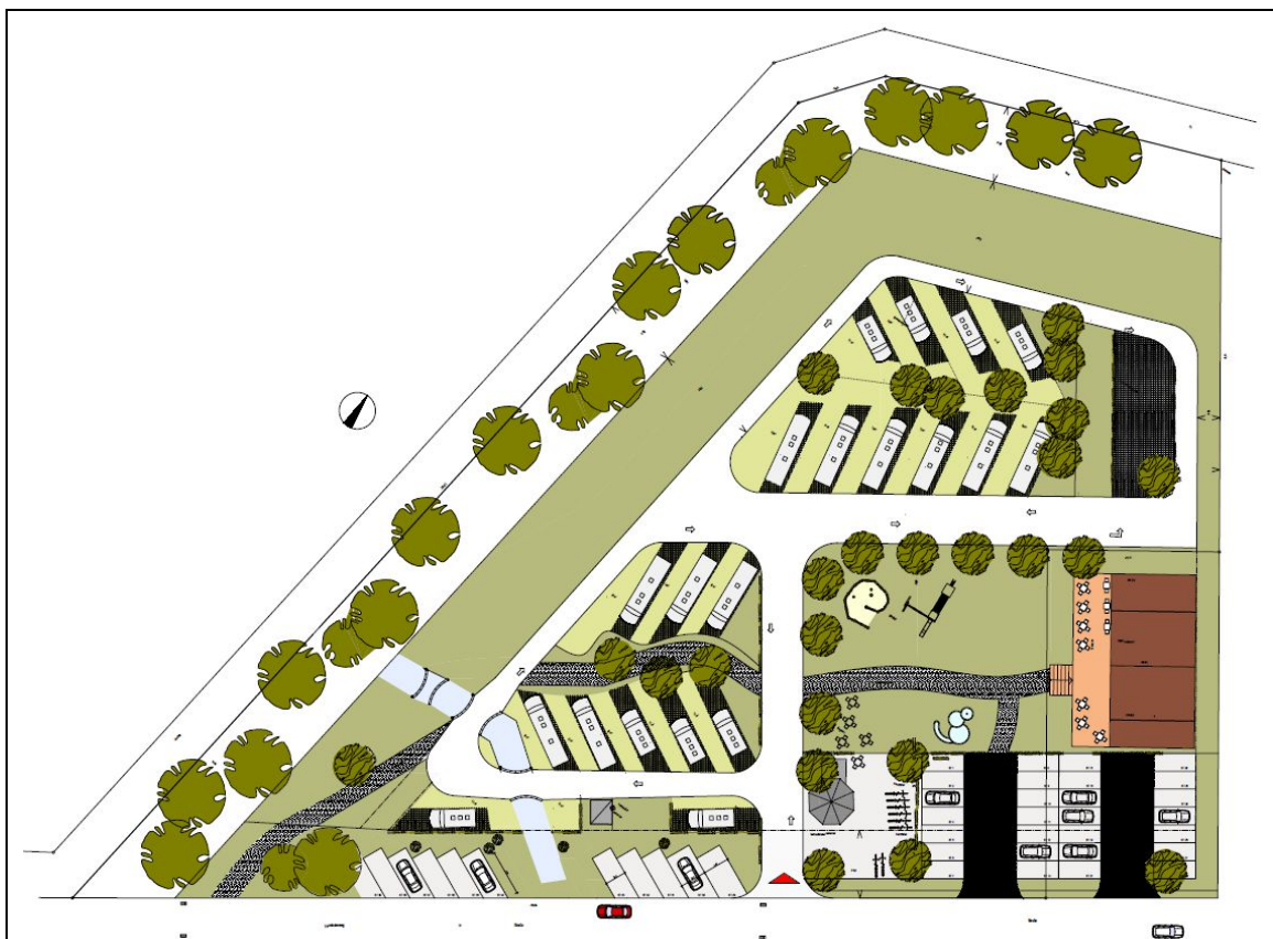
Abb. 1: Lageplan zum Bebauungsvorschlag mit Wohnmobilstellplätzen und Parkplätzen sowie dem integrierten Gebäude im Osten.