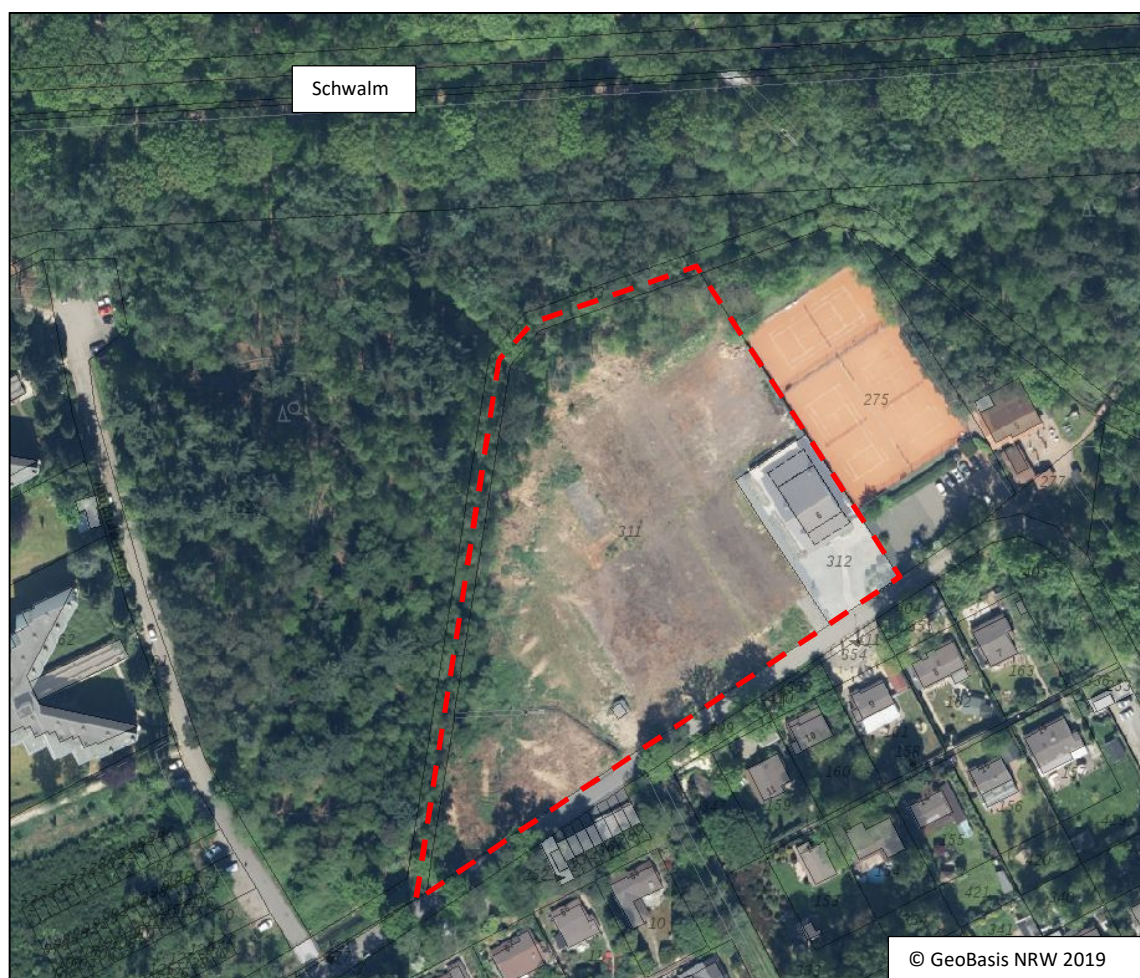
Abb. 3: Luftbild der Fläche, das die ungenutzten Flächen (ehem. Tennisplätze) und das Gebäude zeigt.

Wie auf dem Luftbild (Abb. 3) zu erkennen ist, ist der allergrößte Teil der Planfläche derzeit ungenutzt (Flurstück 311) und ist nur randlich mit wenigen Gehölzen bestockt. Auf der Fläche befanden sich ehemals Tennisplätze. Der westliche und nördliche Teil der Fläche soll zu Wohnmobil-Stellplätzen umgewandelt werden (Abb. 1). Dieser Teil ist durch einen Graben begrenzt. Entlang der südlich gelegenen Straße und vor dem bestehenden Gebäude sollen Parkplätze entstehen. Östlich grenzen die noch genutzten Tennisplätze des Elmpter Tennis Clubs e.V. an. Westlich und nördlich grenzt eine Waldfläche an, durch die eine Zufahrt mit Parkplätzen verläuft. Unmittelbar südlich beginnt die Bebauung von Venekoten.