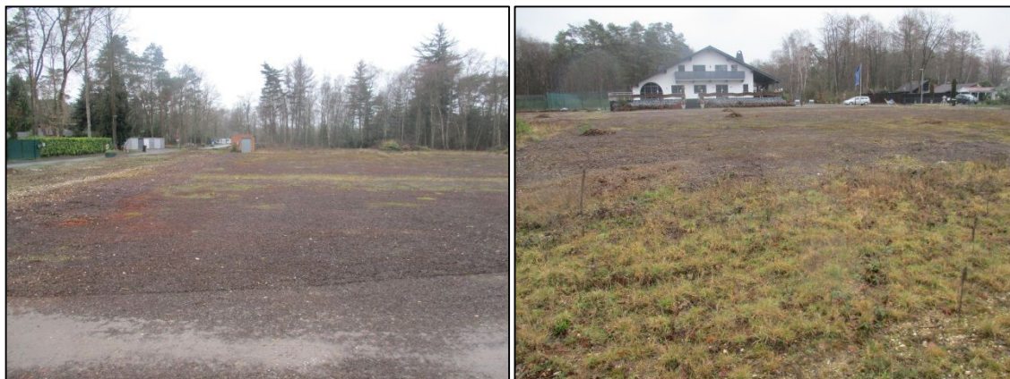
Abb. 4a/b: Ansicht der Fläche nach Westen (links) und nach Osten (rechts).