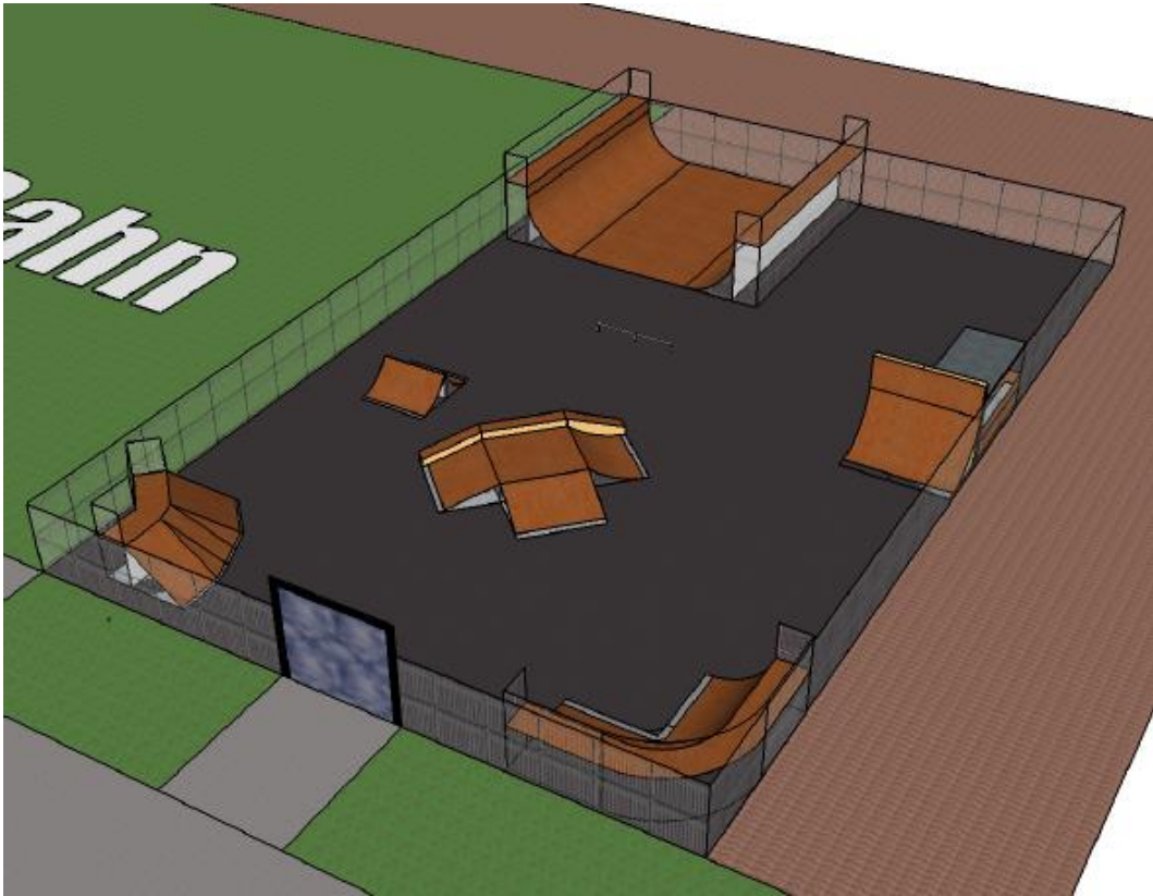
Variante Half-Pipe mit Skatepark am Standort „Lehmkul“

Die verschiedenen Varianten werden in den nachstehenden Grafiken vorgestellt.