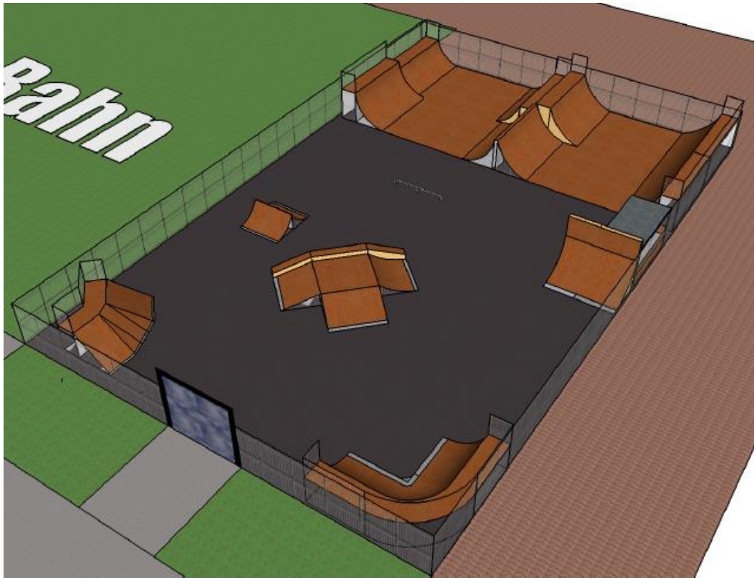
Variante Mini-Ramp mit Skatepark am Standort „Lehmkul“

Für die Herrichtung einer entsprechenden Fläche am Standort Lehmkul (30m x 20m) wurden seitens der Verwaltung Kosten in Höhe von ca. 157.000,00 Euro ermittelt. Diese beinhalten beispielsweise Erdarbeiten, Asphaltierung, Entwässerung und Einfriedung des Geländes. Da es sich bei der Fläche Lehmkul bereits um ein gemeindeeigenes Grundstück handelt, entstehen keine Kosten für den Grunderwerb. Die Verwaltung weist dennoch darauf hin, dass für eine Nutzung der gemeindeeigenen Fläche am Standort Lehmkul zunächst bestehende Pachtverträge gekündigt werden müssten.