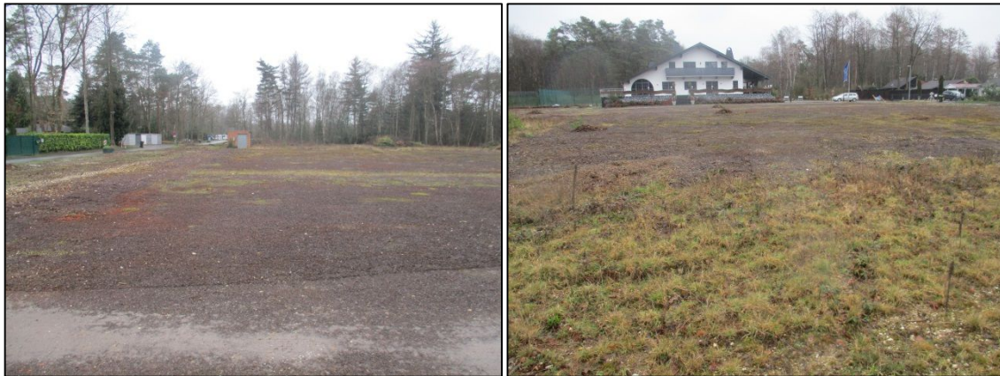
Abb. 4a/b: Ansicht der Fläche nach Westen (links) und nach Osten (rechts).