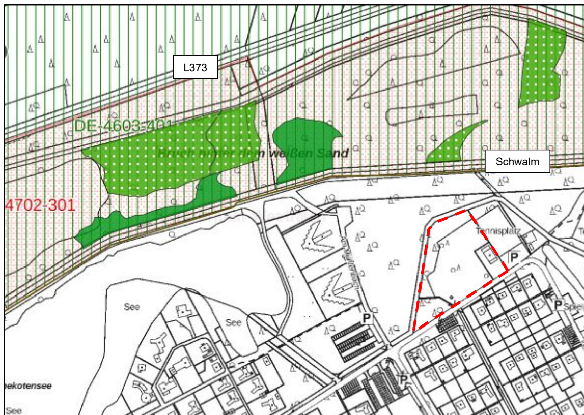
Abb. 5: FFH-Lebensraumtypen (grün) befinden sich zwischen Schwalm und L373. Dabei handelt es sich um Hainsimsen-Buchenwald (LRT 9110; hellgrün) und alte bodensaure Eichenwälder (LRT 9190; dunkelgrün).

Die nachfolgende Abbildung zeigt die für das hiesige Verfahren besonders zu beachtenden FFH-Lebensraumtypen (farbig innerhalb des rot markierten FFH-Gebietes). Es handelt sich dabei um reine Wald-Biototypen die in 60 bis 150 m Abstand beginnen und recht kleinräumig ausgewiesen sind.