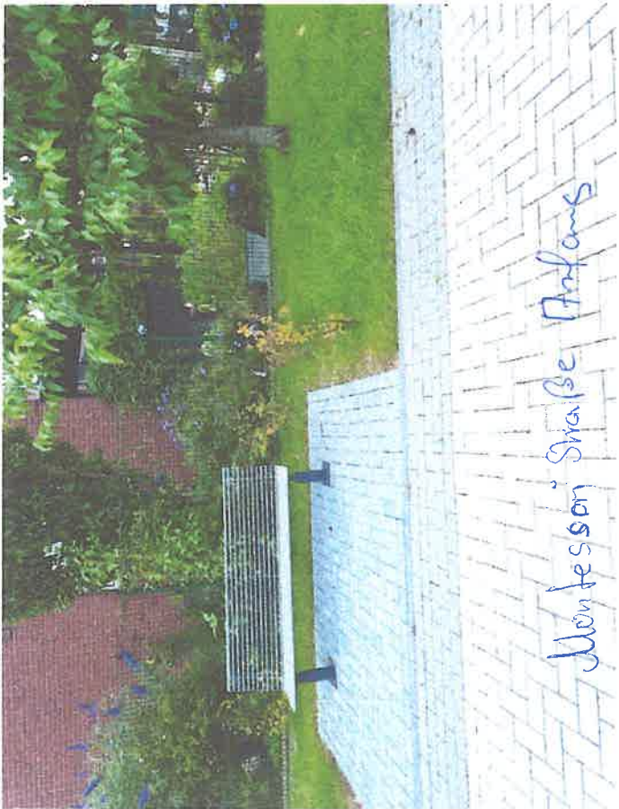
Montessori Straße Anfang