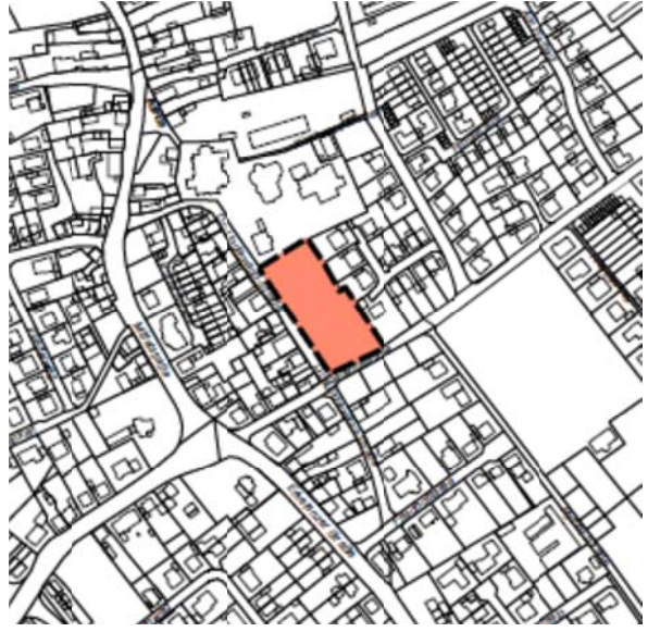
Abb. 2: Flächennutzungsplan Berichtigung